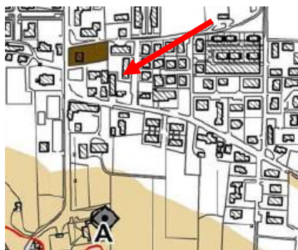
Estratto Tavola 5 - Piano Antenne